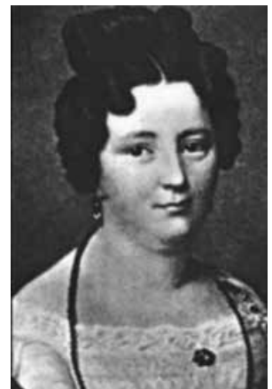
Amalie Heine (1800–1838)

Während des Studiums lässt ihn die Liebe zu Molly trotzdem nicht los.