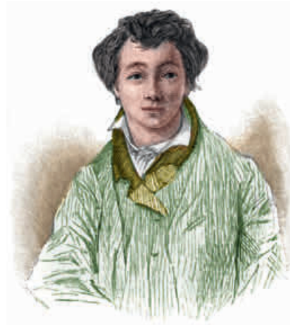
Heinrich Heine (1797–1856)