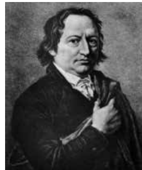
Johann Wolfgang Goethe (1749-1832)